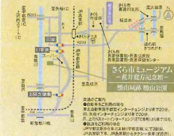
荒井寛方家 豊田秀吉 (昭和2年頃) 当館所蔵