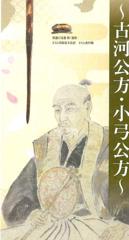
喜連川文書 斧・栗形 さくら市指定文化財 さくら市所蔵